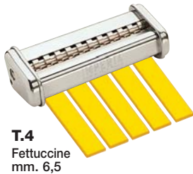
T.4 Fettuccine mm. 6,5