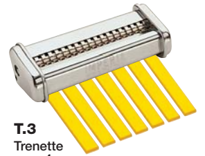
T.3 Trenette mm. 4