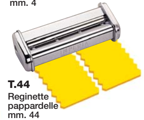
T.44 Reginette pappardelle mm. 44