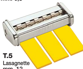
T.5 Lasagnette mm. 12